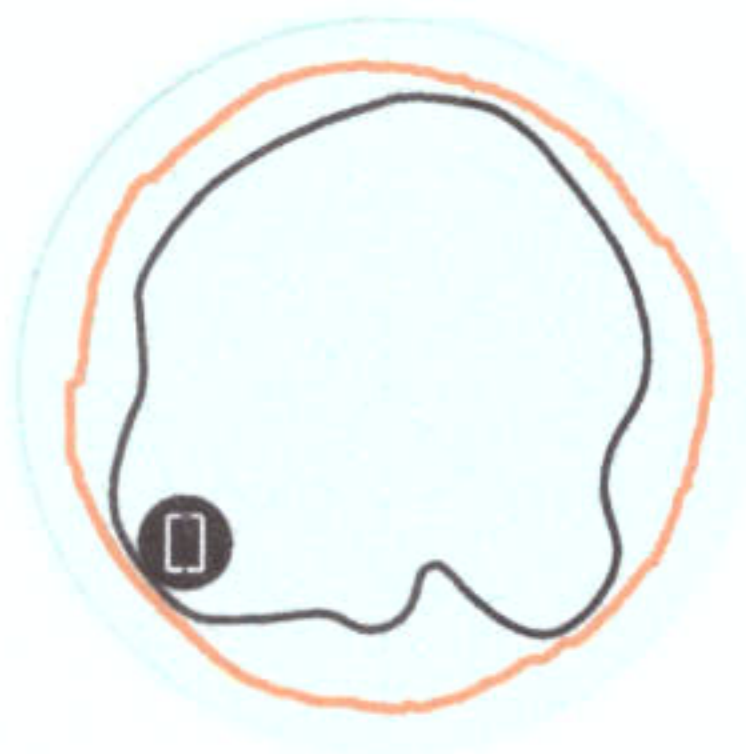
Figure 2 - T310d 2.4GHz Azimuth Antenna Patterns