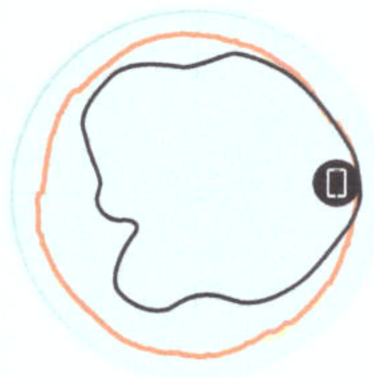
Figure 3 - T310d 5GHz Azimuth Antenna Patterns