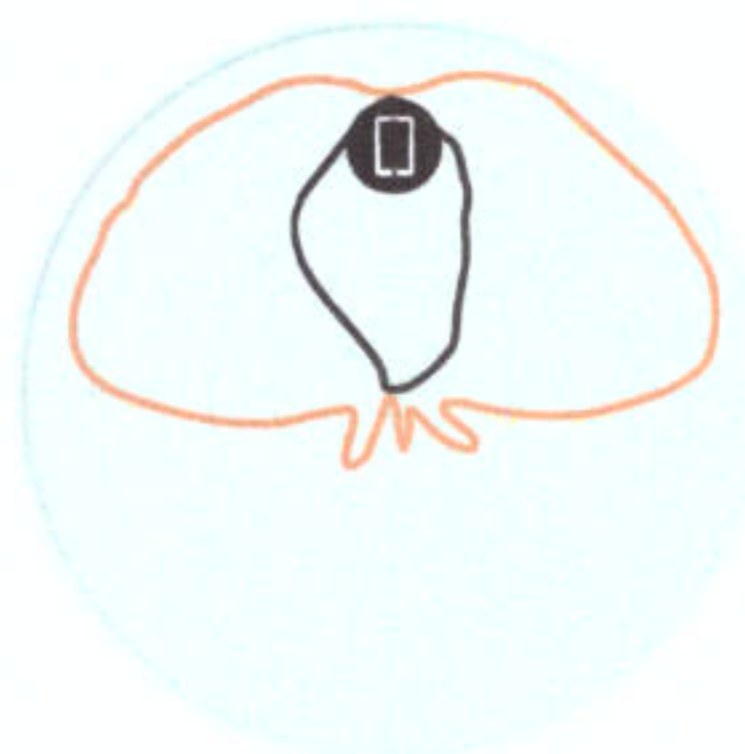
Figure 4 - T310d 2.4GHz Elevation Antenna Patterns